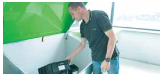
RECA RFID iBox