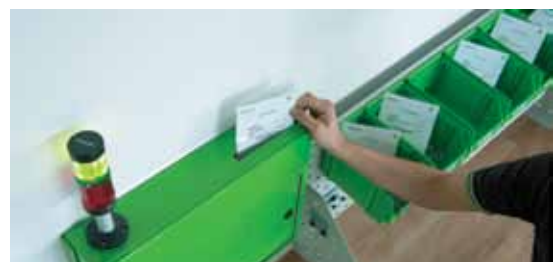
RECA RFID iTagbox

Kellner & Kunz AG - Zentrale Boschstraße 37 A-4601 Wels Tel.: +43(0) 7242/484-0 Fax: +43(0) 7242/484-920 u. 929 info@reca.co.at