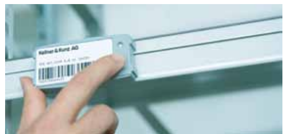
RECA RFID iPush