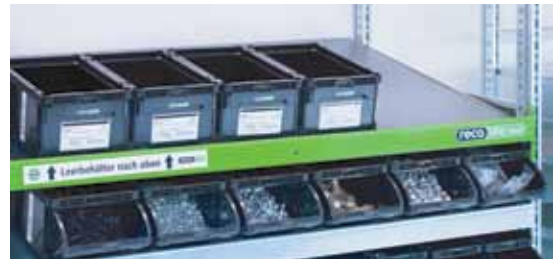
RECA RFID iShelf

Als Kunde legen Sie mit dem neuen System selbst die Bedarfsauslösung fest und bestimmen, wann Sie mit einem neuen befüllten Behälter nachbestückt werden möchten.